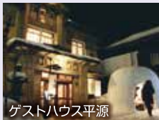
ゲストハウス平源

☀️ こうじ庵 横手の地酒と田舎名物が楽しめる期間限定「イデハ茶屋」がオープン！ (10:00～21:00)